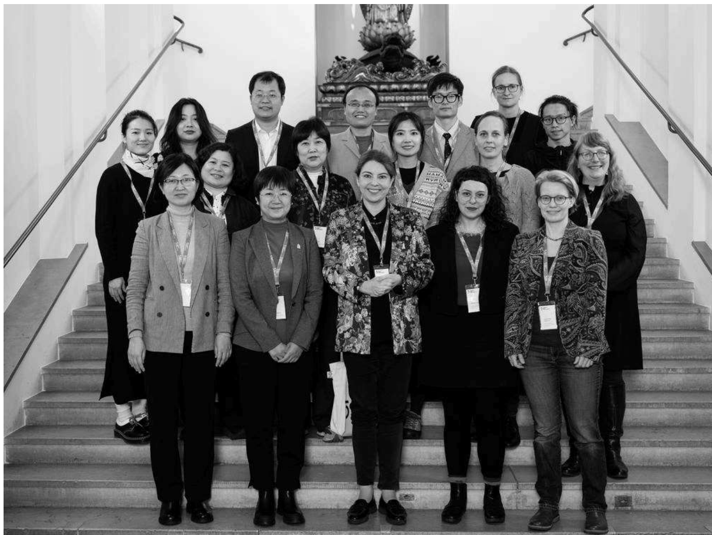
Gruppenfoto von der „Boxerloot“-Tagung in München

Schnell wurde klar: Die Verluste können bestenfalls am Einzelfall geklärt werden, der detaillierte Überblick aber wird weiter fehlen – zumal es seit Jahrhunderten einen von allen Seiten als legal betrachteten Handel mit Objekten aus China gibt. Im Boxer-Krieg aber brach die öffentliche Ordnung in Peking vollkommen zusammen. Sogar der Ahnentempel der Dynastie wurde im Herbst 1900 aufgebrochen und ausgeraubt, noch bevor die französische Armee eingerückt war, wie Niklas Leverenz aus Hamburg in seinem Vortrag zeigte.