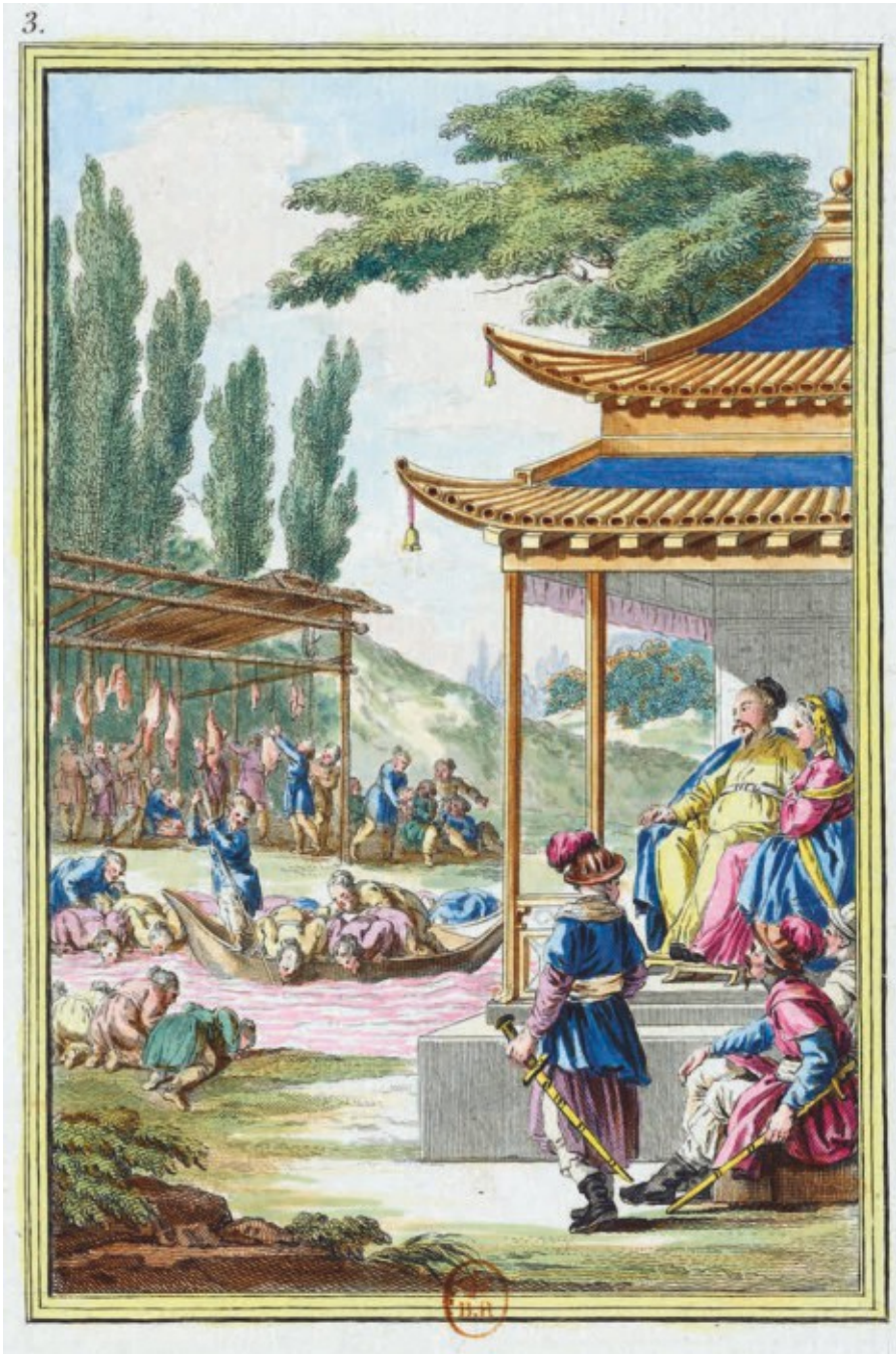
Abb. 1: Vergeudung von Lebensmitteln. "III e Estampe", in: HELMAN, Faits mémorable (s. . 2), ohne Seitennummerierung (Bibliothèque nationale de France, RES GR FOL-02N-624, 1-3).