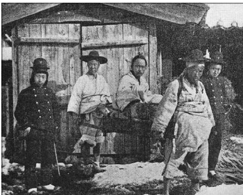
Арест выданного одним из руководителей секты командующего Южной армией Чон Бонджуна в декабре 1894 г. Чон Бонджун был казнен после допросов в марте 1895 г.

Огонь карателей выкосил передние ряды повстанцев, пали их знаменосцы. Раненый Ким Сунмён был схвачен и тут же обезглавлен солдатами Хон Гехуна, его голову подвесили на захваченное у тонхаков желтое знамя. Деморализованные огромными потерями тонхаки , увидав это зрелище, дрогнули и, преследуемые правительственными войсками, бежали в город, где заперли ворота и стойко отбивали все попытки солдат взять город штурмом. На поле боя остались лежать тела более 500 повстанцев, еще столько же попали в руки карателей и были обезглавлены на виду защитников Чонджу.