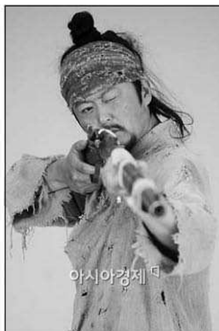
Повстанец-тонхак. Современная реконструкция