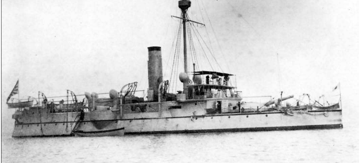
Цинский броненосец «Пинъюань»

8.05.1894 рота под командованием Вон Серока с артиллерией (2 x75 мм. пушки Круппа и 2 митральезы Гатлинга), имуществом и снаряжением была погружена на «Чханнён», рота И Хаксына погрузилась на «Ханъян», остальные 3 роты под командованием И Духвана, О Гоньёна и О Воньёна вместе со свитой Хон Гехуна поднялись на борт «Пинъюань». Вместо громоздкого провианта с целью экономии времени и сил Хон Гехуну были выданы деньги – из расчета по 100 мун{9} на каждый день похода на 1 солдата.