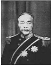
Ли Хэ, командир броненосца «Пинъюань», весной 1894 г. принял участие в подавлении восстания тонхаков и лично инспектировал укрепления Чонджу, построенные корейскими карателями