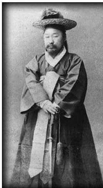
Офицеры охранных войск, до 1895 г.