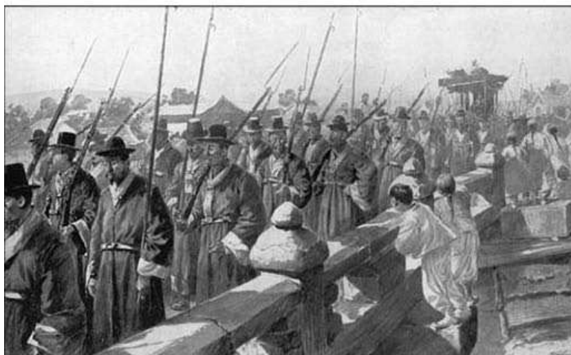
Процессия, сопровождаемая вооруженным эскортом, до 1895 г.