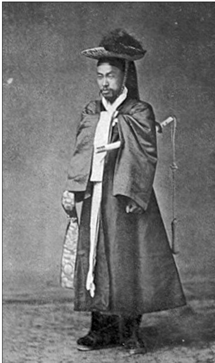
Офицер охранных войск. 1890-е.