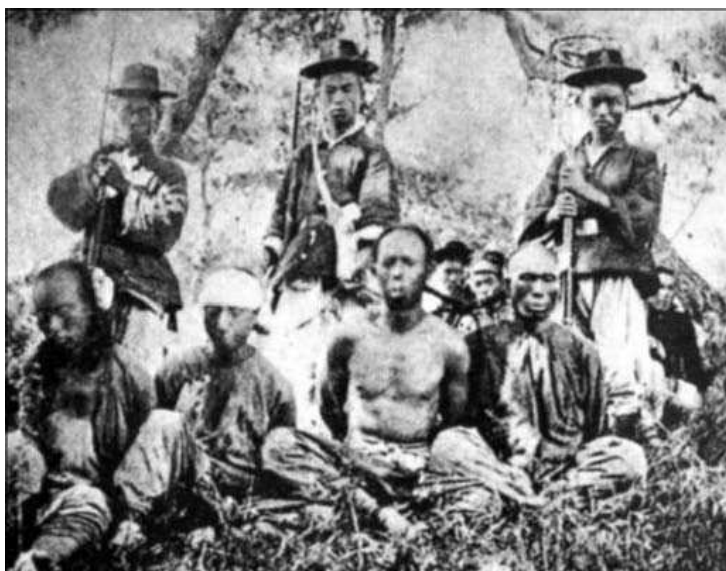
Корейские солдаты охраняют пленных китайцев. Обычно это фото с подачи современных японских авторов атрибутируют как корейских солдат, охраняющих плененных в битве при Пхеньяне 15-16.09.1894 цинских солдат, однако подлинные дата и атрибуция фотографии неизвестны. Возможно, это солдаты, охраняющие пойманных китайских хунхузов или охотников, перешедших корейскую границу