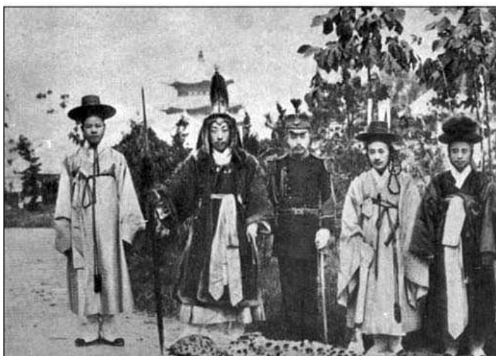
Униформа корейских чиновников и офицеров в период реформ. Заметно появление униформы европейского типа. Ок. 1895 г.