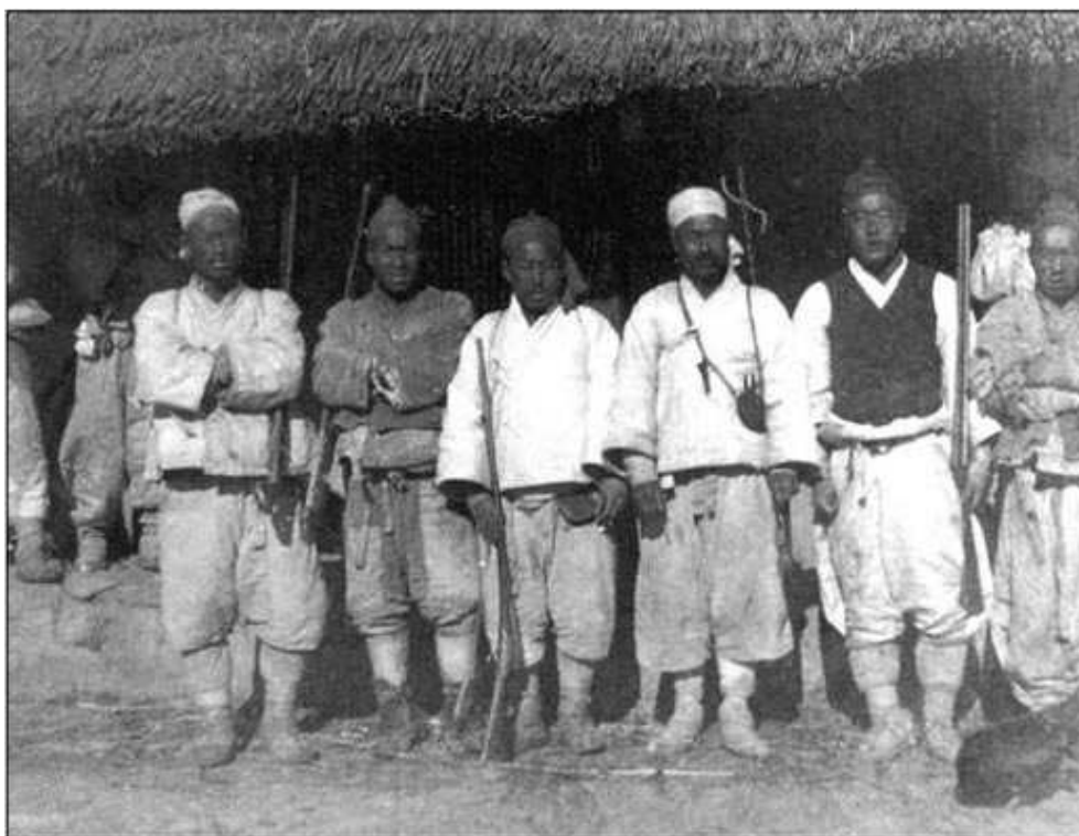
Члены отрядов Ыйбён, ок. 1900 г. Однако аналогичным образом могли выглядеть и повстанцы-тонхаки. Разве что с двуствольными ружьями на руках у местного населения в Корее в 1894 г. было сложно