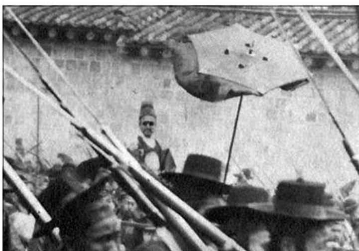
Шествие государя Коджона (на заднем плане в темных очках) в сопровождении вооруженной охраны. До 1895 г.