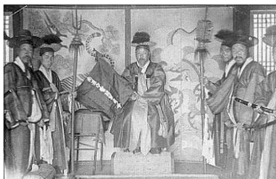
Вооруженная свита корейского чиновника. 1880-е.