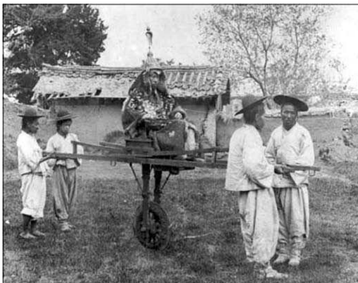
Корейский военачальник в коляске, до 1895 г. Такие архаичные коляски – своего рода визитная карточка дореформенной Кореи, атрибут высокопоставленного чиновника – военного или гражданского