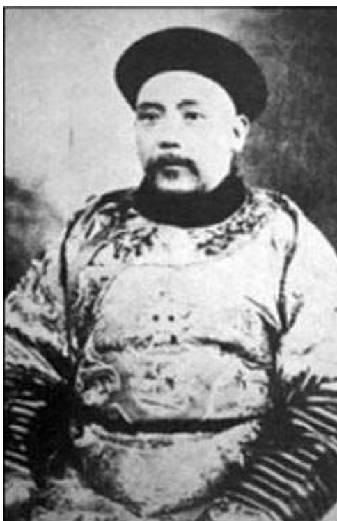
Юань Шикай, постоянный представи- тель империи Цин в Корее до 1.08. 1894. Инициатор и провод- ник политики цинского вытеснения Японии из Кореи, сторонник оккупации Кореи и пре- вращения ее в цинскую провинцию

3.05.1894 командир Чанвиён чоннёнган {3} Хон Гехун был назначен пёнса {4} провинции Чолла, но уже 6.05.1894 решение было отменено – Хон Гехуну предписывалось срочно принять командование над карательной экспедицией в составе 5 рот гвардии с артиллерией и немедленно выдвинуться в район восстания. Сановники Нэмубу {5} запросили у государя Коджона санкции на предельно жестокое подавление восстания: «Считаем, [что надо] подавлять и покорять, давить и убивать в тех землях, какова будет [высочайшая воля]?». Разрешение было дано.