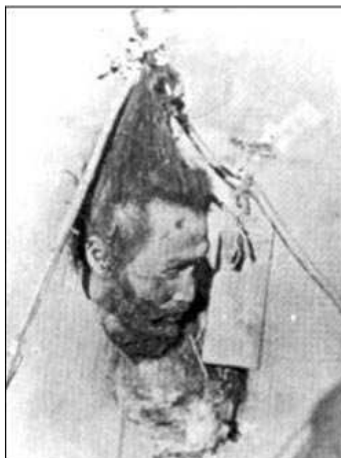
Голова казненного лидера повстанцев, выставленная на всеобщее обозрение. Обычно атрибутируют, как голову Чон Бонджуна, однако полной уверенности в этом нет – можно принять его и за Чхве Сихёна