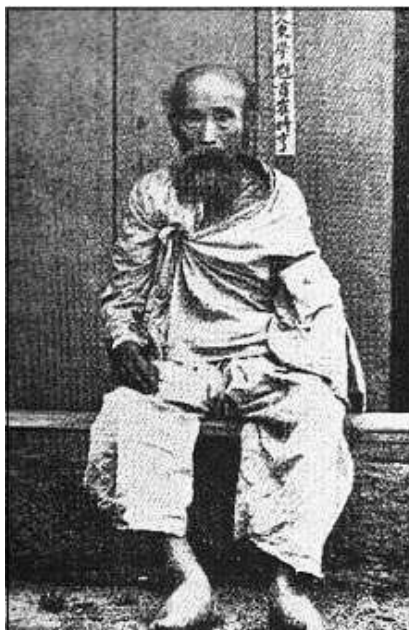
Чхве Сихён, патриарх учения в 1894 г. Осенью 1894 г. присоединился к Северной армии повстанцев, после поражения повстанцев скрывался. В 1898 г. был схвачен властями и казнен

В 1860 г. незаконнорожденный сын небогатого дворянина из провинции Кёнсан Чхве Джеу (1824-1864) объявил о создании собственного вероучения, которое было призвано заменить все существующие в Корее религии и вытеснить быстро распространяющееся в стране Западное Учение ( сохак ), т.е. католичество. Свое учение Чхве Джеу нарек тонхак , т.е. Восточное Учение. У новоявленного пророка нашлись сторонники, община стала быстро увеличиваться в численности. Но ее деятельностью заинтересовались агенты корейского правительства – некоторые положения доктрины Чхве Джеу показались им заимствованными у католиков, гонения на которых в 1860-х проводило корейское правительство. Возникло подозрение, что Чхве Джеу – тайный проповедник католицизма. В 1864 г. Чхве Джеу был арестован и казнен по обвинению в распространении христианства в Корее.