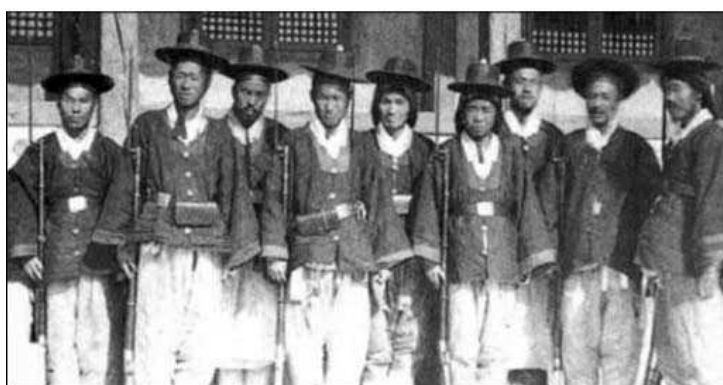
Группа корейских солдат, отобранных для обучения в качестве инструкторов. Имеется дата снимка 19.03.1881, однако полной уверенности в этом нет, поэтому можно датировать широко – от 1881 до 1885 гг.