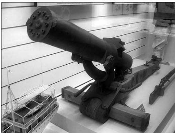
Митральеза Гатлинга. Экспозиция Музея Армии в Сеуле