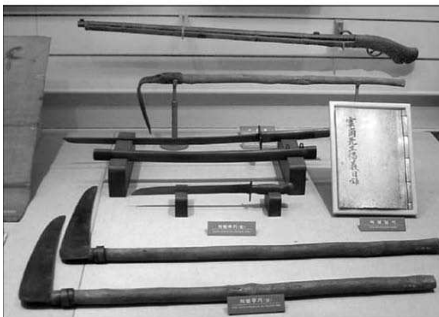
Оружие повстанцев в 1894-1895 гг. Экспозиция Музея Армии в Сеуле