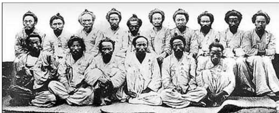
Группа тонхаков. Скорее всего, фото сделано после ареста