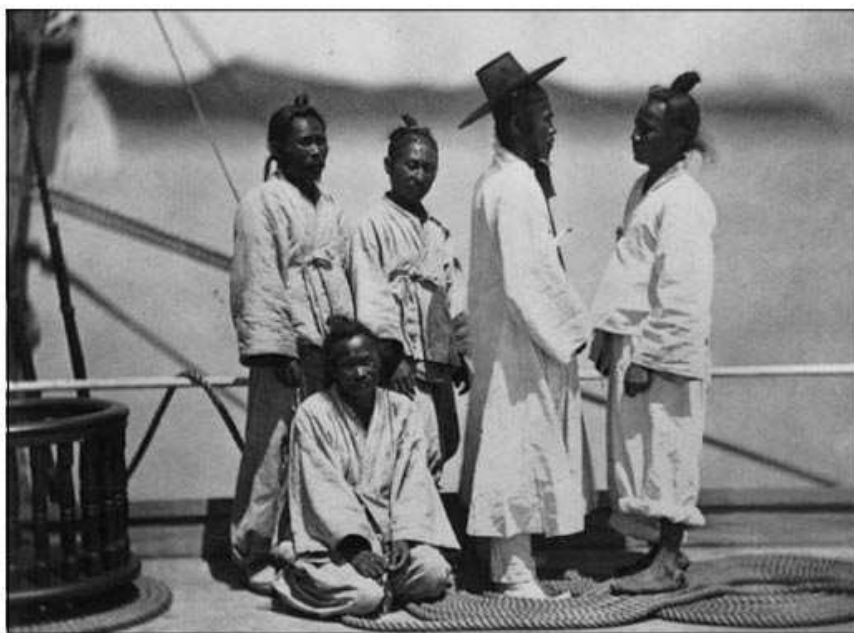
Пленные корейские солдаты, 1871 г. Типичный случай использования местного населения в качестве резерва для армии во время боев против американцев. Можно использовать для демонстрации внешнего вида корейского солдата без оружия и амуниции

административной и тактической организации, отсутствии современного военного образования и офицерского корпуса, отсталым вооружением.