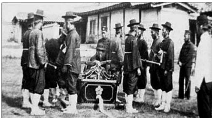
Корейские солдаты из охраны дворца с церемониальным предметом. Ок. 1895 г. Сочетание старой и новой униформы заставляет предположить конец 1894 или 1895 г.