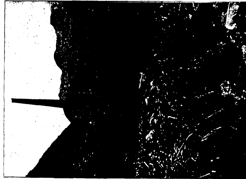
Besonders hoher Kampfturm bei Marbang.