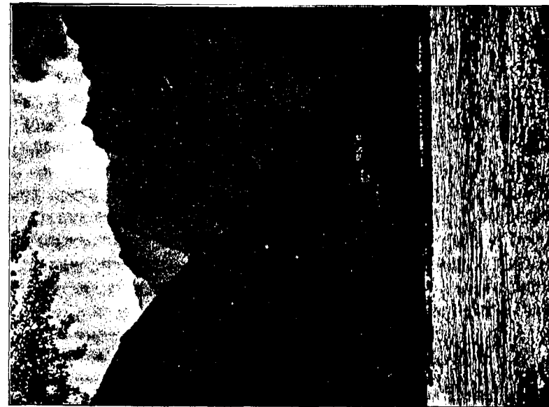
Kleiner Goldstrom zwischen Meino und Janggu.