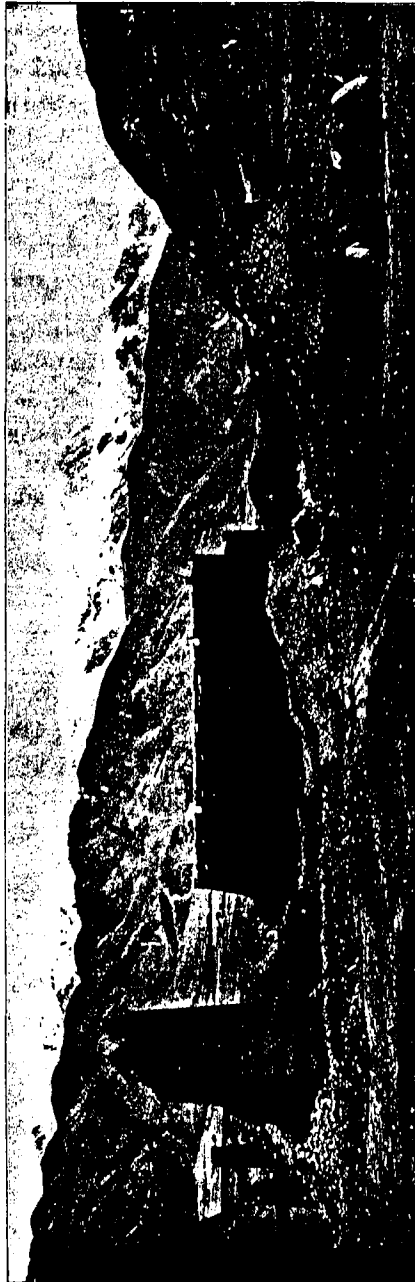
Landschaft im Gebiet des Ming-jeng-Stammes.