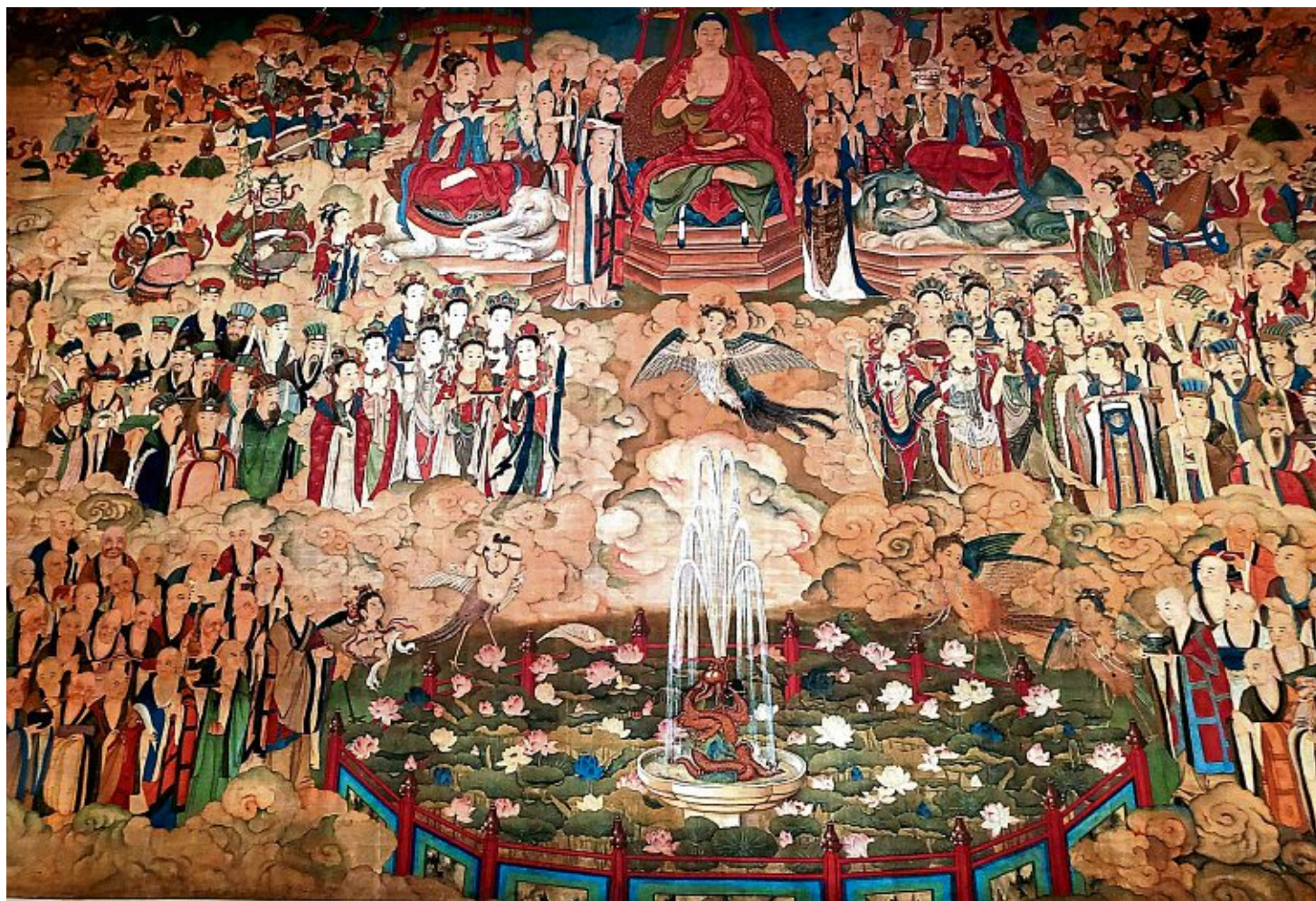
Auch das mehr als 200 Jahre alte Wandbild „Die Predigt des Buddha“ im China-Saal des Humboldt-Forums stammt vermutlich aus Plünderungen.

Boxerloot“ hieß die Ta- gung, die – aus deutscher Sicht – ungezählte Pein- lichkeiten zur Sprache brachte: Plünderung, Raub, Gier, Hehlerei verübt in China um 1900 nicht nur von Militärs, sondern auch von Diplomaten und deren Gattinnen, Missionarinnen und Missionaren, Geschäftsleuten, Mu- seumsmitarbeitern. Sie verschal- cherten riesige Mengen an Porzellan, rituellen Objekten, Waffen, Ge- malden, Büchern, Alltagsgegen- ständen. Die wertvollen Dinge waren kaiserlichen Palästen, Grä- bern, Tempeln, Geschäften und Privathaushalten entnommen worden.