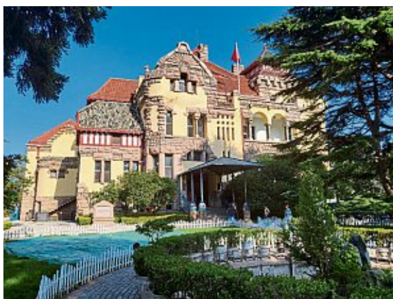
Die Villa des Gouverneurs der deutschen Kolonie Kiautschou in China beherbergt heute ein Museum.

Aus einer Mitteilung des Münchner Museums Fünf Kontinente