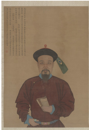
(图六) 缪炳泰《铁保像》故宫博物院藏

所有的紫光阁功臣像，画家们绘制时都不落名款，所以确定这些“功臣像”的作者只能参照档案和实录等文献资料。因鄂辉此画像涉及乾隆五十一年至乾隆五十三年二月平定台湾林爽文、庄大田叛乱事，查《清宫内务府造办处档案总汇》之《乾隆五十三年各作成做活计清档》中四月二十六日所记“军机大臣奉旨：着缪炳泰恭绘画功臣像五十轴，应用纸绢、颜料、木桩等项向造办处要用。钦此。”《乾隆五十四年各作成做活计清档》所记“三月，如意馆。十七日接得员外郎福庆押帖一件，内开二月初二日将缪炳泰现画得功臣大像三十一幅、手卷小像十一人，持进交太監玉进福呈览，奉旨：交如意馆绘画衣纹，其余外任各员俟来京时再行补画。钦此。”从这两则“内务府造办处档案”中的记载，我们可以比较明确地知道，此幅《成都将军法什尚阿巴图鲁云骑尉鄂辉像》的主要部分，是出自宫廷画家缪炳泰之手。