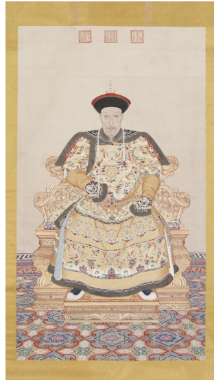
(图七)《乾隆皇帝朝服像》 故宫博物院藏