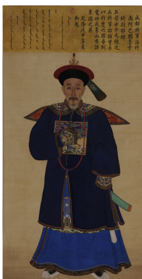
(图一) 佚名 鄂辉像