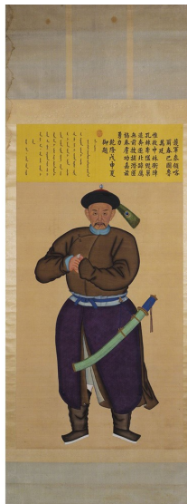
(图十)《护军参领喀尔春巴图鲁万廷像》轴

另，平定台湾后三十功臣像中，也有一大幅正图见于拍卖市场。《护军参领喀尔春巴图鲁万廷像》轴（图十），先前曾见于2009年香港的“苏富比公司”秋拍，2011北京的中国嘉德公司请我去观赏该图，据公司方面介绍，该图是从意大利征集来的，现为私人收藏。画幅诗堂上右书汉文：“惟彼中林，冲阵孔棘，夺隘毁巢，近奔逐北，蹕后无前，搜捕潜匿，协奏肤功，嘉兹勇力。乾隆戊申夏御题。”左边为同样内容之满文。画幅为绢本设色画，尺寸不详（因当时未顺手记下）。此功臣为平定台湾后三十功臣之一，但是题赞的文字却是由皇帝所撰写的，不知为何与其他几次功臣像不同？因为未见平定台湾后三十功臣像另外的画幅，无从比较，待考。