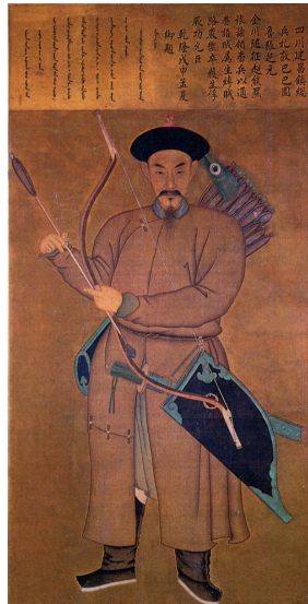
(图九)《四川建昌镇总兵扎敦巴巴图鲁张芝元图》轴

平定台湾叛乱前二十功臣的第十八位张芝元的画像，即《四川建昌镇总兵扎敦巴巴图鲁张芝元图》轴（图九），现在已经不是原先的装裱式样了，画幅上端诗堂的题词与下方的图像分为两体，被分别装在玻璃镜框内。画为绢本设色，绘画部分纵155厘米、横95厘米，题字部分纵32厘米、横96厘米。画上的文字如下：“四川建昌镇总兵扎敦巴巴图鲁张芝元，金川随征，超熊羆旅，兹领番兵，以通番语，贼属生缚，贼路严御，卒获生俘，厥功允巨。乾隆戊申孟夏御题。”左边为同样内容之满文。图中的功臣为全身立像，头戴一眼花翎，身穿长袍，左手持弓，右手握箭，背后挂箭囊，腰间悬腰刀及弓袋，足登高靴。“乾隆戊申”为乾隆五十三年（1788年）。