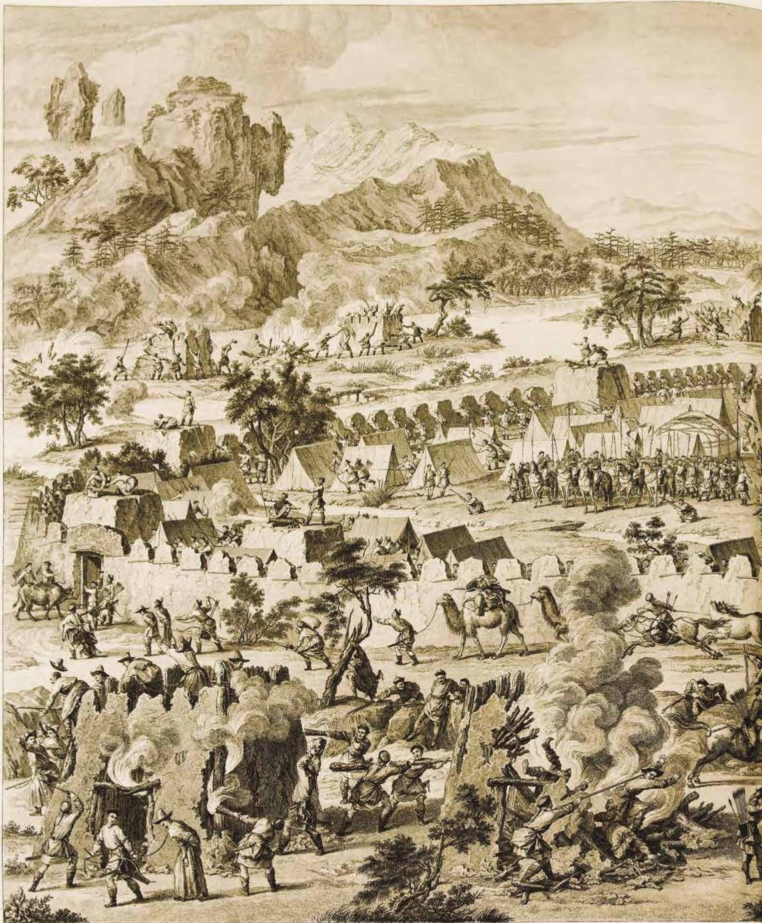
N°43. Extremely rare, complete suite of 16 large copper engravings, commemorating