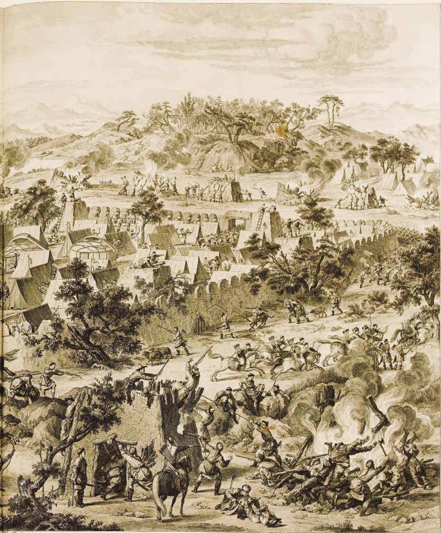
Emperor's Qianlong's victorious campaigns in Central Asia between 1755-1759.